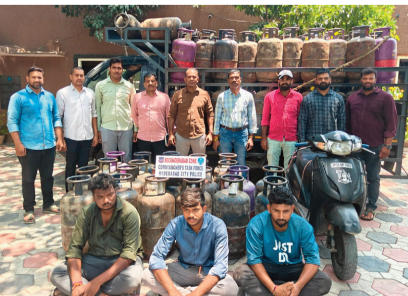
సికింద్రాబాద్ లో వాణిజ్య ఎల్ టీసీ సివిల్ సర్కిల్ బ్లాక్ మార్కెట్ మురూసు హైదరాబాద్ టాన్సిఫికేషన్ పట్టుకుంది. వీరిలో ఇద్దరు గ్యాస్ డెలివరీ బాయ్స్ తో సహా ముగ్గురిని అరెస్ట్ చేసి రూ. 7.5 లక్షల విలువైన 129 సివిల్ సర్కిల్ పాటు నగదు, వాహనాలు స్వాధీనం చేసుకుంది.