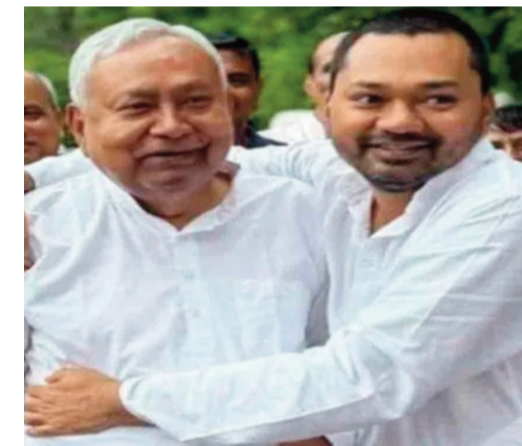
నుంచి 12 మంది, జేడీయూ నుంచి 11 మంది, ఎల్ జేపీ (రామ్ విలాస్) నుంచి ఇద్దరు, హెచ్ పిఎం, ఆర్ ఎల్ విలస్ నుంచి చెరొకరికి మంత్రివర్గంలో చోటు కల్పించనున్నారు.