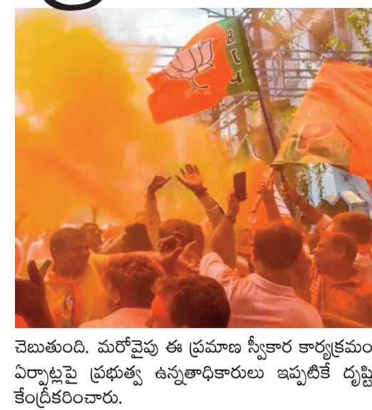
చెబుతుంది. మరోవైపు ఈ ప్రమాణ స్వీకార కార్యక్రమం ఏర్పాట్లపై ప్రభుత్వ ఉన్నతాధికారులు ఇప్పటికే దృష్టి కేంద్రీకరించారు.

సమీక్ భట్టాచార్య బుధవారం కోల్కతాలో ప్రకటించారు. ఉదయం 10 గంటలకు మహానగరంలోని ప్రతిష్టాత్మక ట్రిగ్గెడ్ వరేడ్ గ్రౌండ్స్ లో ఈ కార్యక్రమం జరుగుతుందని వివరించారు. గురువారం సాయంత్రం కోల్కతాలో శాసనసభా పక్ష సమావేశం జరుగుతుందని సమీక్ భట్టాచార్య తెలిపారు. ఈ సమావేశంలో శాసనసభా పక్ష నేతను పార్టీ ఎమ్మెల్యేలు అంతా కలిసి ఎన్నుకుంటారని చెప్పారు. ముఖ్యమంత్రిగా ప్రమాణ స్వీకార కార్యక్రమానికి ప్రధాని సరేంద్ర మోడి, పలువురు కేంద్ర మంత్రులు, బీజేపీ పాలిత రాష్ట్రాల ముఖ్యమంత్రులు, ఎన్డీయే నాయకులు హాజరవుతారని అంచనా వేస్తున్నారు. కార్యక్రమానికి పార్టీ సీనియర్ నేతలతోపాటు కార్యకర్తలు పెద్ద ఎత్తున హాజరవుతారని పార్టీ నేతలు చెబుతున్నారు. పశ్చిమ బెంగాల్ లో కొత్తగా కొలువైన సన్న మంత్రి పద్యంలో దాదాపు 24 మంది మంత్రులుగా ప్రమాణ స్వీకారం చేసే అవకాశాలు ఉన్నాయని రాష్ట్ర నాయకత్వం