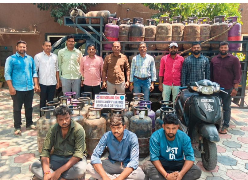
సికింద్రాబాద్ లో వాణిజ్య ఎల్ టీవీ సినిమా ట్రాక్ మార్కెట్ మురూసా హైదరాబాద్ టాన్సిఫోర్మ్ పట్టుకుంది. వీరిలో ఇద్దరు గ్యాస్ డెలివరీ బాయ్స్ తో సహా ముగ్గురిని అరిస్ట్ చేసి రూ. 7.5 లక్షల విలువైన 129 సినిమా ట్రాక్ పాటు నగదు, వాహనాలు స్వాధీనం చేసుకుంది.