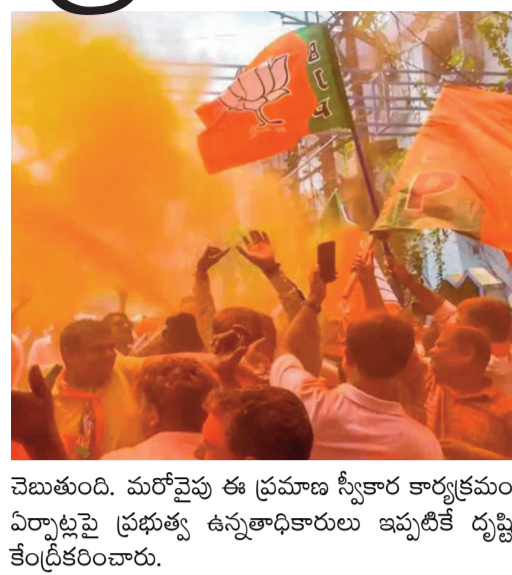
చెబుతుంది. మరోవైపు ఈ ప్రమాణ స్వీకార కార్యక్రమం ఏర్పాట్లపై ప్రభుత్వ ఉన్నతాధికారులు ఇప్పటికే దృష్టి కేంద్రీకరించారు.

సమీక్ భట్టాచార్య బుధవారం కోల్కతాలో ప్రకటించారు. ఉదయం 10 గంటలకు మహానగరంలోని ప్రతిష్టాత్మక ట్రిగ్గెడ్ వరేడ్ గ్రౌండ్స్ లో ఈ కార్యక్రమం జరుగుతుందని వివరించారు. గురువారం సాయంత్రం కోల్కతాలో శాసనసభా పక్ష సమావేశం జరుగుతుందని సమీక్ భట్టాచార్య తెలిపారు. ఈ సమావేశంలో శాసనసభా పక్ష నేతను పార్టీ ఎమ్మెల్యేలు అంతా కలిసి ఎన్నుకుంటారని చెప్పారు. ముఖ్యమంత్రిగా ప్రమాణ స్వీకార కార్యక్రమానికి ప్రధాని సరేంద్ర మోడి, పలువురు కేంద్ర మంత్రులు, బీజేపీ పాలిత రాష్ట్రాల ముఖ్యమంత్రులు, ఎన్డీయే నాయకులు హాజరవుతారని అంచనా వేస్తున్నారు. కార్యక్రమానికి పార్టీ సీనియర్ నేతలతోపాటు కార్యకర్తలు పెద్ద ఎత్తున హాజరవుతారని పార్టీ నేతలు చెబుతున్నారు. పశ్చిమ బెంగాల్ లో కొత్తగా కొలువైన సన్న మంత్రి పద్యంలో దాదాపు 24 మంది మంత్రులుగా ప్రమాణ స్వీకారం చేసే అవకాశాలు ఉన్నాయని రాష్ట్ర నాయకత్వం