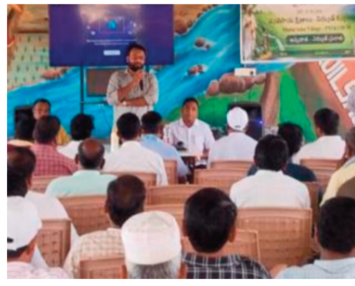
ప్రజానావ, నారాయణపేట: తెలంగాణ రాష్ట్ర ప్రభుత్వం చేపట్టిన ప్రజా పాలన - ప్రగతి పాలన 99 కోణాల

కార్యవరణ ప్రణాళిక లో భాగంగా, గురువారం మరికల్ రైతు వేదికలో "రైతు వారోత్సవాలు" కార్యక్రమాన్ని ఘనంగా నిర్వహించారు. ఈ కార్యక్రమాన్ని వ్యవసాయ శాఖ మరియు విద్యుత్ శాఖ సంయుక్త ఆధ్వర్యంలో నిర్వహించి, రైతులకు వ్యవసాయ యాంత్రీకరణ ఆయిల్ పామ్ సాగు, నాన్ యూరియా వినియోగం, ప్రకృతి వ్యవసాయం పై వ్యవసాయ శాఖ ద్వారా అవగాహన కల్పించారు. అదేవిధంగా విద్యుత్ శాఖ ఆధ్వర్యంలో రైతులకు లిఫ్ట్ కునుమ్ పథకం గురించి వివరించి, సోలార్ పంప్ సెట్ల వినియోగం మరియు ప్రభుత్వ సబ్సిడీలపై సమాచారం అందించారు. కార్యక్రమంలో ఆధునిక వ్యవసాయ సాంకేతికతలో భాగంగా డ్రోన్ టెక్నాలజీపై ప్రత్యేక ప్రదర్శన నిర్వహించి, డ్రోన్ ద్వారా పంటలపై మందుల