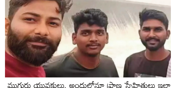
ముగ్గురు యువకులు, అందులోనూ ప్రాణ స్నేహితులు ఇలా ఒకేసారి మృతి చెందడంతో నర్సాపూర్ లో విషాదం నెలకొంది. పెళ్లికి వెళ్లి వస్తామని చెప్పిన కొడుకులు శవాలై రావడంతో తల్లిదండ్రులు గుండెలవిసేలా రోదిస్తున్నారు. పోలీసులు మృతదేహాల పోస్టుమార్టం నిమిత్తం అనుమతికి తరలించి, కేసు నమోదు చేసి దర్యాప్తు చేస్తున్నారు. జలాశయాలు, వాగుల వద్దకు వెళ్లేటప్పుడు యువత అప్రమత్తంగా ఉండాలని, నీటి లోతు తెలియకుండా లోపలికి వెళ్లడం ప్రాణాంతకమని ఈ ఘటన మరెవరికీ హెచ్చరిస్తోంది.

నాడు మెదక్ జిల్లా తూప్రాన్ లో జరిగిన ఒక పెళ్లి వేడుకకు హాజరయ్యారు. వివాహ వేడుక అనంతరం, గురువారం ఉదయం తిరుగు ప్రయాణంలో సిద్దిపేట జిల్లా వర్షల్ మండలం నాచారం సమావేశానికి హల్బీ వాగు వద్దకు చేరుకున్నారు. ఎండ తీవ్రత ఎక్కువగా ఉండటంతో.. సరదాగా వాగులో ఈత కొట్టాలని నిర్ణయించుకున్నారు. వాగులోకి దిగిన ఈ ముగ్గురు స్నేహితులకు నీటి లోతుపై అవగాహన లేకపోవడంతో ప్రమాదవశాత్తు నీటిలో మునిగిపోయారు. గల్లంతైన యువకుల కోసం స్థానికులు, పోలీసులు గాలింపు చర్యలు చేపట్టారు. గురువారం ఉదయం పోలీసులు, గజ ఈతకాళ్ల సహాయంతో గాలించగా.. ముగ్గురి మృతదేహాలు లభ్యమయ్యాయి. మృతులంతా ఒకే వయసు వారు (27 ఏళ్ల) కావడంతో ఆ ప్రాంతంలో విషాద ఛాయలు అలుముకున్నాయి. ఒకే ఊరికి చెందిన