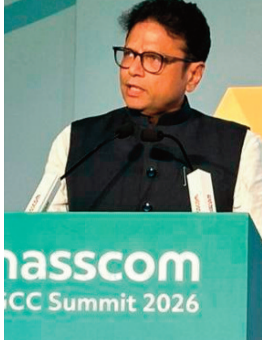
అలాంటి చారిత్రక తప్పిదాన్ని హైదరాబాద్ విషయంలో తాము చేయాలనుకోవడం లేదన్నారు. అందుకే.. భవిష్యత్తు కోసం ఎదురు చూడకుండా, దాన్ని నిర్మించే బాధ్యతను తీసుకున్నామన్నారు. ఆ దిశగానే భారత్ పూర్వ సీటీ, ఏబి