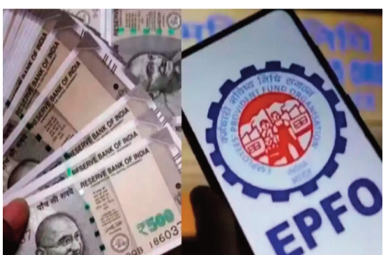
8.31 కోట్ల క్లెయిమ్లను పరిష్కరించింది. ఇందులో 71 శాతం అడ్వాన్స్ క్లెయిమ్లను కేవలం మూడు రోజుల్లోనే ఆటో విధానంలో క్రియర్ చేయడం విశేషంగా మారింది. అలాగే 1.59 కోట్ల మంది సభ్యులు యజమాని ప్రమేయం లేకుండానే తమ బ్యాంక్ వివరాలను న్వయంగా నవీకరించుకున్నట్లు వెల్లడించారు.

పసంపాదించుకునే అవకాశం ఉంటుంది. అత్యవసర వైద్య ఖర్చులు, కుటుంబ అవసరాల కోసం కార్యాలయాల చుట్టూ తిరగాల్సిన అవసరం లేకుండానే ఈ సేవలు అందుబాటులోకి రానున్నాయి. ఈపీఎఫ్ఎస్ సభ్యుల కోసం ప్రత్యేకంగా పీఎఫ్ ఏటీఎం కార్డులను జారీ చేయాలని సంస్థ యోచిస్తోంది. ఈ కార్డులు నేరుగా సభ్యుల పీఎఫ్ ఖాతాలకు అనుసంధానమై ఉంటాయి. అలాగే యూపీఎన్ఎస్ అనుసంధానించిన బ్యాంక్ ఖాతా ద్వారా యూపీఐ సేవలను ఉపయోగించుకునే విధంగా సాంకేతిక మార్పులు చేస్తున్నారు. మే నెలాఖరులోపు ఈ సేవలు అందుబాటులోకి వచ్చే అవకాశముందని సమాచారం. అయితే ఈ డిజిటల్ సేవలను వినియోగించుకోవాలంటే కొన్ని అర్హతలు తప్పనిసరిగా ఉండాలి. సభ్యుడికి యాక్టివ్ యూపీఎన్ ఉండాలి. కేవల ప్రక్రియ పూర్తి ఉండాలి. ఆర్డర్, పాస్ కార్డు, బ్యాంక్ ఖాతా వివరాలు, ఐఎఫ్ఎస్సీ కోడ్ వంటి సమాచారం పీఎఫ్ ఖాతాలో అనుసంధానమై ఉండాలి. ఇక కేంద్ర కార్మిక శాఖ వెల్లడించిన వివరాల ప్రకారం 2025-26 ఆర్థిక సంవత్సరంలో ఈపీఎఫ్ఎస్ రికార్డు స్థాయిలో