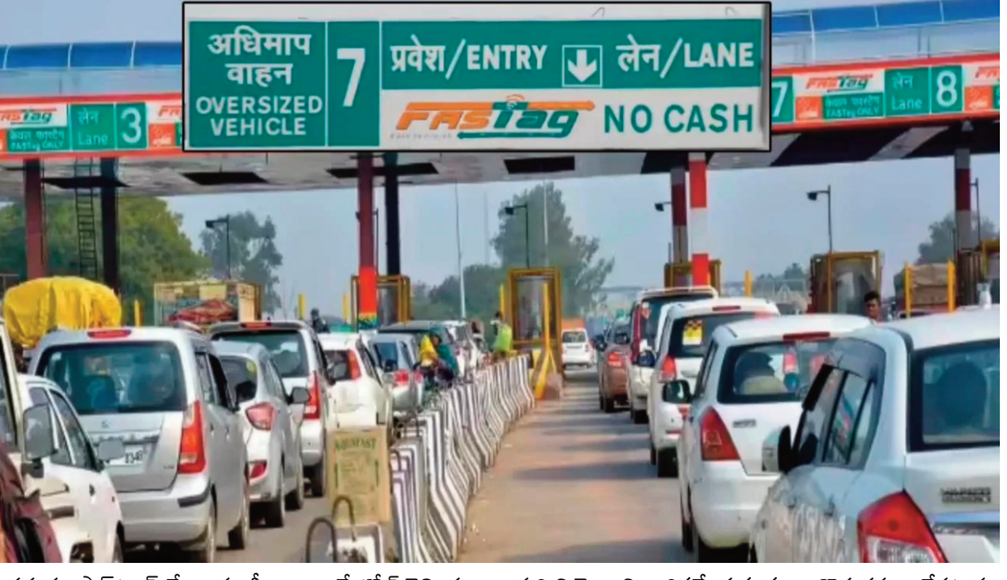
ప్రస్తుతం ఫాస్ట్యాగ్ లేదా యూపీఐ ద్వారానే బోలీ చెల్లింపులు చేయాల్సి ఉంటుంది. ఒకవేళ ఫాస్ట్యాగ్ పనిచేయకపోతే యూపీఐ ద్వారా చెల్లింపు చేసే సమయంలో అదనంగా 25 శాతం ఛార్జీ విధించే అవకాశముందని సమాచారం. అలాగే గుర్తింపు కార్డుల ఆధారంగా బోలీ మినహాయింపుల

న్యూఢిల్లీ: ఫాస్ట్యాగ్ వినియోగదారులకు జాతీయ రహదారుల ప్రాధికార సంస్థ కీలక హెచ్చరిక జారీ చేసింది. కొత్త మార్గదర్శకాల ప్రకారం ఫాస్ట్యాగ్ ను సరైన విధంగా ఉపయోగించకపోతే రెడ్డింపు బోలీ ఛార్జీలు చెల్లించాల్సి వస్తుందని స్పష్టం చేసింది. తాజా నిబంధనల ప్రకారం వాహనదారులు తమ ఫాస్ట్యాగ్ ను వాహనం ముందు అద్దం లోపలి భాగంలో తప్పనిసరిగా అతికించాలి. ఒకవేళ ఫాస్ట్యాగ్ యాక్టివ్ ఉన్నప్పటికీ దానిని చేతిలో చూపించడం లేదా వాహనంలో ఎక్కడైనా ఉంచడం చేసినట్లయితే ఆ ట్యాగ్ ను బ్లాక్ లెస్ట్ గా పరిగణించే అవకాశం ఉందని అధికారులు హెచ్చరించారు. ఇలాంటి వాహనాల నుంచి బోలీ ఛార్జీలు వద్ద రెడ్డింపు బోలీ ఫీజు వసూలు చేయనున్నట్లు వెల్లడించారు. బోలీ బాటల్ వద్ద స్యానింగ్ ప్రక్రియ వేగంగా పూర్తవుడం, ట్రాఫిక్ రద్దీ తగ్గించడం లక్ష్యంగానే ఈ నిర్ణయం తీసుకున్నట్లు తెలిపారు. బోలీ ఛార్జీలు వద్ద అమర్చిన సీసీ కెమెరాల అద్దంపై ఫాస్ట్యాగ్ ను సరిగా లేకపోయిన వాహనాలను గుర్తించే అధికారులు పేర్కొన్నారు. అందువల్ల బోలీ నిబ్బందితో వాగ్దారులకు దిగినా ప్రయోజనం ఉండదని స్పష్టం చేశారు. ఇకపై నగదు చెల్లింపులపై కూడా కఠిన నిబంధనలు అమల్లోకి వచ్చాయి. ఏప్రిల్ 2026 నుంచి జాతీయ రహదారులపై నగదు ద్వారా బోలీ చెల్లింపులను పూర్తిగా నిలిపివేశారు.