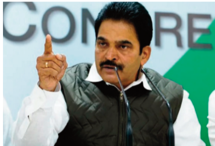
పార్టీ అధ్యక్షుడికి పరిశీలకుల నివేదిక

న్యూఢిల్లీ: కేరళంలో కాంగ్రెస్ సారథ్యంలోని యూడిఎఫ్ కూటమి విజయం సాధించడంతో ముఖ్యమంత్రి అంబికకు కనరత్తు జరుగుతోంది. ఈ రేసులో లోక్ సభ ఎంపీ కేసీ వేణుగోపాల్ ముందున్నారని తెలుస్తోంది. ఈ మేరకు పార్టీ పరిశీలకులు అజయ్ మాకెస్, ముకుల్ వాస్తికేలు తమ నివేదికను పార్టీ అధ్యక్షుడు మల్లికార్జున్ ఖ