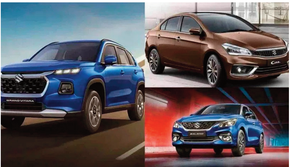
మారుతి సుజుకీ ఈ భారీ ఆఫర్లను తీసుకొచ్చినట్లు అటోమొబైల్ వర్గాలు చెబుతున్నాయి. అయితే ఈ ఆఫర్లు నగరం, డీలర్షిప్, స్టాక్ లభ్యత ఆధారంగా మారే అవకాశం ఉందని కంపెనీ పేర్కొంది.

న్యూఢిల్లీ: దేశీయ కార్ల తయారీ రంగంలో అగ్రగామిగా కొనసాగుతున్న మారుతి సుజుకీ ఈ నెలలో వినియోగదారులకు భారీ శుభవార్త అందించింది. అమ్మకాలను పెంచడం, కొత్త కొనుగోలుదారులను ఆకర్షించడం లక్ష్యంగా పలు మోడల్లపై ప్రత్యేక రాయితీలు ప్రకటించింది. కొన్ని వాహనాలపై రూ.2 లక్షలకు పైగా డిస్కాంట్లు అందుబాటులో ఉన్నట్లు కంపెనీ వెల్లడించింది. కంపెనీ ప్రకటించిన ఆఫర్ల ప్రకారం ప్రాంక్స్ మోడల్పై రూ.25 వేల వరకు, సెలేరియోపై రూ.27,500, ఈకో స్టార్పై రూ.37,500, ఎస్-ప్రెస్సీపై రూ.37,500 వరకు రాయితీలు లభించనున్నాయి. అలాగే సియాజ్, బాలెనో మోడల్లపై రూ.40 వేల వరకు తగ్గింపు అందిస్తున్నారు. స్విఫ్ట్ సీఎస్జీ, జిమ్నీ మోడల్లపై రూ.45 వేల వరకు, ఇగ్నిస్ బ్లాక్ ఎడిషన్పై రూ.50 వేల వరకు ప్రత్యేక ఆఫర్ ప్రకటించారు. ఆల్టో కే10, వ్యాగన్ ఆర్ మోడల్లపై రూ.52,500 వరకు డిస్కాంట్ లభించనుంది. బ్రెజ్జాపై రూ.55 వేల వరకు, విక్రోయా మోడల్పై రూ.70 వేల వరకు తగ్గింపు అందిస్తున్నారు. ఇక అత్యధిక రాయితీలు గ్రాండ్ విటారా, ఇన్విక్టో మోడల్లపై ప్రకటించారు. గ్రాండ్ విటారాపై రూ.1.08 లక్షల వరకు, ఇన్విక్టోపై రూ.2.15 లక్షల వరకు ప్రత్యేక డిస్కాంట్లు లభించనున్నాయి. పెరుగుతున్న పోటీ నేపథ్యంలో వినియోగదారులను ఆకట్టుకునేందుకు