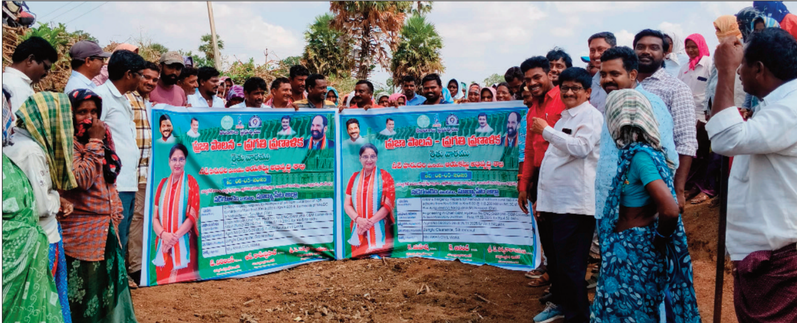
భారతకేంద్రంలో ఆర్-9 కాలవల పూడిక తొలగింపు పనులు..

ప్రజానావ, ముంగలూరు: రాష్ట్ర ప్రభుత్వం ప్రతిష్టాత్మకంగా నిర్వహిస్తున్న ప్రజాపాలన - రైతు వారం కార్యక్రమంలో భాగంగా ముంగలూరు మండలం భారతకేంద్రం గ్రామంలో ఆర్-9 లిఫ్ట్ ఇరిగేషన్ స్కీమ్కు సంబంధించిన కాలవల