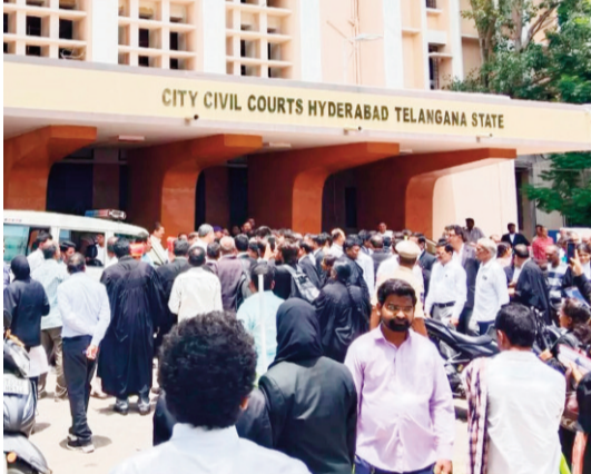
ఇప్పటివరకు సోషల్ మీడియాలో పోస్ట్ చేసిన వీడియో క్లిప్పింగులు, డిజిటల్ కంటెంట్, పత్రికా కటింగులు, వార్ పోస్టర్లు తక్షణం తొలగించాలని స్పష్టం చేసింది. ఈ నెల