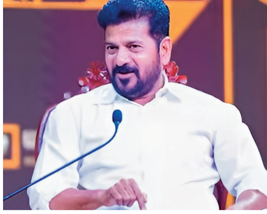
అని స్పష్టం చేశారు. కాంగ్రెస్ ముందు ప్రకటించి తర్వాత

శుక్రవారం హైదరాబాద్ వేదికగా సీఎం మూల్యులారూ. డి.పీ.పీ.లో పదేళ్లు పనిచేశానని. సీఎం చంద్రబాబు ఇప్పటికీ తనను గౌరవిస్తారని ప్రస్తావించారు. పార్టీని వదిలిపెట్టిన తర్వాత నాయకుల మధ్య మంచి సంబంధాలు ఉండటం చాలా అరుదని తెలిపారు. పార్టీని వదిలిపెట్టే సమయంలో విజయవాడకు వెళ్లి చంద్రబాబుకు చెప్పి వచ్చానని గుర్తుచేశారు. కాంగ్రెస్ను దేశంలో అధికారంలోకి తేవాలని రాహుల్ గాంధీకి లక్ష్యం ఉందని...కానీ ప్రధాని కావాలన్న లక్ష్యం లేదని స్పష్టం చేశారు. వికారాబాద్ లో జరిగిన కాంగ్రెస్ సమావేశంలో ప్రధాని పదవి తీసుకోవాలని తానే రాహుల్ గాంధీకి చెప్పి ఒప్పించానని ప్రస్తావించారు. ఇప్పుడు జనం స్వీగ్ని పాలిటిక్స్ కోరుకుంటున్నారని అన్నారు. వచ్చే ఎన్నికల్లో ఇండియా కూటమి నుంచి ప్రధాని అభ్యర్థి రాహుల్ గాంధీనే