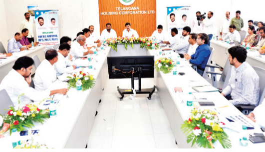
ఇది ఇక్కడితో ఆగిపోదని, అర్హులైన ప్రతి లబ్ధిదారునికి ఇల్లు అందే వరకు మాడో, నాలుగో విడతలుగా కొనసాగుతుందని స్పష్టం చేశారు. ఉమ్మడి రాష్ట్రంలో ఇందిరమ్మ పథకం కింద రూ.20 వేల వరకు సాయం పొందిన వారికి కూడా మళ్లీ ఇందిరమ్మ ఇండ్లు మంజూరు చేస్తామని తెలిపారు. పైలట్ గ్రామాల్లో 600 చదరపు అడుగులకు పైగా నిర్మించిన

గూడులేని ప్రతి అర్థ పేద కుటుంబానికి సొంత ఇల్లు కల్పించడమే ప్రభుత్వ లక్ష్యమని పేర్కొన్నారు. దేశంలో ఏ రాష్ట్ర ప్రభుత్వం ఇప్పుటి విధంగా ఒక్కో ఇంటికి రూ.5 లక్షల ఆర్థిక సాయం అందిస్తూ తెలంగాణ ప్రభుత్వం పేదల గృహనిర్మాణంలో దేశానికి ఆదర్శంగా నిలుస్తోందన్నారు. తొలి విడతలో 3 లక్షలకు పైగా ఇండ్లను మంజూరు చేశామని, అందులో 2.90 లక్షల ఇండ్లకు గ్రౌండింగ్ పూర్తి కాగా ఇప్పటికే సుమారు 50 వేల గృహప్రవేశాలు జరిగాయని తెలిపారు. మరో రెండు లక్షలకు పైగా ఇండ్లు వివిధ దశల్లో నిర్మాణంలో ఉన్నాయని, రెండు నెలల్లో పూర్తి అవుతాయని చెప్పారు. ప్రతి నియోజకవర్గానికి 3,500 ఇండ్లు మంజూరు చేసినట్లు మంత్రి వెల్లడించారు. బీడీపీ ప్రాంతాల నియోజకవర్గాలకు అదనపు ఇండ్లు కేటాయించినట్లు తెలిపారు. రెండో విడత ఇందిరమ్మ ఇండ్ల మంజూరు కార్యక్రమాన్ని జూన్ 2న ఆదిలాబాద్ జిల్లాలో ప్రారంభిస్తామని పేర్కొన్నారు.