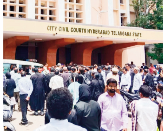
ఇప్పటివరకు సోషల్ మీడియాలో పోస్ట్ చేసిన వీడియో క్లిప్పింగులు, డిజిటల్ కంటెంట్, పత్రికా కటింగులు, వార్ పోస్టర్లను తక్షణం తొలగించాలని స్పష్టం చేసింది. ఈ నెల