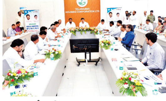
ఇది ఇక్కడితో ఆగిపోదని, అర్హులైన ప్రతి లబ్ధిదారునికి ఇల్లు అందే వరకు మాడో, నాలుగో విడతలుగా కొనసాగుతుందని స్పష్టం చేశారు. ఉమ్మడి రాష్ట్రంలో ఇందిరమ్మ పథకం కింద రూ.20 వేల వరకు సాయం పొందిన వారికి కూడా మళ్లీ ఇందిరమ్మ ఇండ్లు మంజూరు చేస్తామని తెలిపారు. పైలట్ గ్రామాల్లో 600 చదరపు అడుగులకు పైగా నిర్మించిన

గూడులేని ప్రతి అర్థ పేద కుటుంబానికి సొంత ఇల్లు కల్పించడమే ప్రభుత్వ లక్ష్యమని పేర్కొన్నారు. దేశంలో ఏ రాష్ట్ర ప్రభుత్వం ఇవ్వని విధంగా ఒక్కో ఇంటికి రూ.5 లక్షల ఆర్థిక సాయం అందిస్తూ తెలంగాణ ప్రభుత్వం పేదల గృహనిర్మాణంలో దేశానికి ఆదర్శంగా నిలుస్తోందన్నారు. తొలి విడతలో 3 లక్షలకు పైగా ఇండ్లను మంజూరు చేశామని, అందులో 2.90 లక్షల ఇండ్లకు గ్రౌండింగ్ పూర్తి కాగా ఇప్పటికే సుమారు 50 వేల గృహప్రవేశాలు జరిగాయని తెలిపారు. మరో రెండు లక్షలకు పైగా ఇండ్లు వివిధ దశల్లో నిర్మాణంలో ఉన్నాయని, రెండు నెలల్లో పూర్తి అవుతాయని చెప్పారు. ప్రతి నియోజకవర్గానికి 3,500 ఇండ్లు మంజూరు చేసినట్లు మంత్రి వెల్లడించారు. బీడీపీ ప్రాంతాల నియోజకవర్గాలకు అదనపు ఇండ్లు కేటాయించినట్లు తెలిపారు. రెండో విడత ఇందిరమ్మ ఇండ్ల మంజూరు కార్యక్రమాన్ని జూన్ 2న ఆదిలాబాద్ జిల్లాలో ప్రారంభిస్తామని పేర్కొన్నారు.