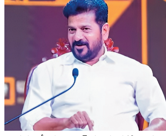
అని స్పష్టం చేశారు. కాంగ్రెస్ ముందు ప్రకటించి తర్వాత

శుక్రవారం హైదరాబాద్ వేదికగా సీఎం మాట్లాడారు. డి.పీ.పీ.లో పదేళ్లు పనిచేశానని.. సీఎం చంద్రబాబు ఇప్పటికీ తనను గౌరవిస్తారని ప్రస్తావించారు. పార్టీని వదిలిపెట్టిన తర్వాత నాయకుల మధ్య మంచి సంబంధాలు ఉండటం చాలా అరుదని తెలిపారు.. పార్టీని వదిలిపెట్టే సమయంలో విజయవాడకు వెళ్లి చంద్రబాబుకు చెప్పి వచ్చానని గుర్తుచేశారు.. కాంగ్రెస్ను దేశంలో అధికారంలోకి తేవాలని రాహుల్ గాంధీకి లక్ష్యం ఉందని...కానీ ప్రధాని కావాలన్న లక్ష్యం లేదని స్పష్టం చేశారు. వికారాబాద్ లో జరిగిన కాంగ్రెస్ సమావేశంలో ప్రధాని పదవి తీసుకోవాలని తానే రాహుల్ గాంధీకి చెప్పి ఒప్పించానని ప్రస్తావించారు. ఇప్పుడు జనం స్వీగ్ని పాలిటిక్స్ కోరుకుంటున్నారని అన్నారు. వచ్చే ఎన్నికల్లో ఇండియా కూటమి నుంచి ప్రధాని అభ్యర్థి రాహుల్ గాంధీనే