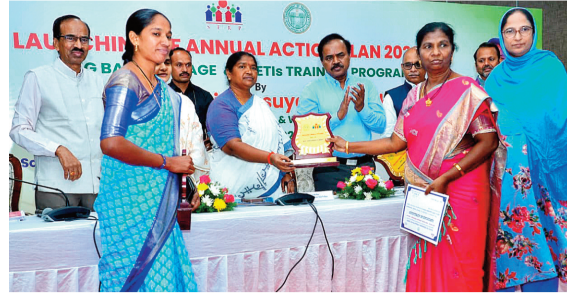
ఆదివాసీ మహిళల ఉత్పత్తులకు మార్కెటింగ్ అవకాశాలు కల్పిస్తున్నాయి. స్ట్రీనిధి మహిళల కోసం మహిళల ఆధ్వర్యంలో నడిచే సంస్థ. స్ట్రీనిధిని కాపాడుకోవాలి. ఉద్యోగ అనుకూల ప్రభుత్వం మా ప్రభుత్వం. స్ట్రీనిధి ఏర్పాటులో, దాన్ని

ప్రజానావ, హైదరాబాద్: ఉద్యోగులు హక్కులతో పాటు విధులు కూడా గుర్తుంచుకోవాలని మంత్రి సీతక్క సూచించారు. స్ట్రీనిధి సంస్థను అందరం కాపాడుకోవాలన్నారు. మహిళల ఆర్థిక స్వావలంబనకు స్ట్రీనిధి తోడ్పాటు అందిస్తోందని వెల్లడించారు. మైక్రో ఫైనాన్స్ బాధల నుంచి మహిళలకు విముక్తి కోసం స్ట్రీనిధి ఏర్పాటుయిందని తెలిపారు. ఇప్పటివరకు రూ.24 వేల కోట్ల రుణాలు పంపిణీ చేసిన స్ట్రీనిధి అని చెప్పారు. 32 లక్షల మహిళలకు రుణాలు అందించినది స్పష్టం చేశారు. తెలంగాణ మహిళలకు నమ్మకమైన బ్యాంకింగ్ స్ట్రీనిధి ఎదగాలన్నారు. ఇతర రాష్ట్రాల కూడా తెలంగాణ స్ట్రీనిధి మోడల్ను అనుసరిస్తున్నాయని.. మహిళల ఆర్థిక స్వావలంబనకు తోడ్పడుతున్న స్ట్రీనిధి బ్యాంకింగ్ కేంద్రం తప్పదు ఆరోపణలు చేస్తున్నారని విమర్శించారు. తప్పుడు ఆరోపణలు వస్తే వెంటనే వెర్రీఫై చేసి చర్యలు తీసుకుంటున్నామన్నారు. అప్పుడు ఆరోపణలతో సంస్థ ప్రతిష్ట దెబ్బతినకూడదని మంత్రి వివరించారు. మహిళల అభివృద్ధి సమాజ అభివృద్ధికి పునాది అని చెప్పారు. చిన్న వ్యాపారాలు, గృహాధారిత ఉపాధికి ప్రభుత్వం ప్రోత్సాహం అందింది.