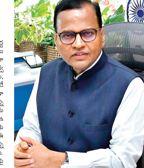
లేకుండా తగు చర్యలు తీసుకోవాలని జిల్లా కలెక్టర్లను ఆదేశించారు.

తెలిపారు. అదేవిధంగా పర్యాటక ప్రాంతాలపై ప్రజల్లో పెద్ద ఎత్తున చైతన్యం కల్పించాలని, పర్యాటక ప్రాంతాలను ప్రజలు సందర్శించేలా తగు చర్యలు చేపట్టాలని అన్నారు. ప్రధానంగా సోఫ్ట్వేర్ కార్యక్రమాలను రాష్ట్ర, జిల్లా, మండలస్థాయిలో నిర్వహించాలన్నారు. ప్రతి కార్యక్రమంలో ప్రజాప్రతినిధులు, క్రీడాకారులు, యువజన సంఘాలను భాగస్వామ్యం చేయాలన్నారు. ఈనెల 18న నిర్వహించే 'ఫిట్- తెలంగాణా థీమ్'తో రాష్ట్ర, జిల్లా కేంద్రాల్లో 5వ రన్, అదేవిధంగా అన్ని మండల కేంద్రాల్లో వ్యాకాణ్, యోగ తదితర కార్యక్రమాలను నిర్వహించాలన్నారు. తెలంగాణలో పర్యాటక రంగానికి ఉన్న అపారమైన అవకాశాలను ప్రపంచానికి చాటి చెప్పేందుకు ఈ వారోత్సవాలు దోహదపడతాయని, దీనిలో భాగంగా ఈ వారం రోజులు రాష్ట్ర ప్రభుత్వ ఆధ్వర్యంలోని అన్ని మ్యూజియంలలో ఉచిత ప్రవేశం కల్పించనున్నట్లు వెల్లడించారు. అదేవిధంగా జిల్లాల్లో కొనసాగుతున్న ధాన్యం కొనుగోళ్లపై కూడా జిల్లా కలెక్టర్లతో బిలికాన్ఫరెన్స్ ద్వారా సమీక్షించారు. గౌరవ ముఖ్యమంత్రి ఆదేశాల మేరకు ధాన్యం కొనుగోళ్లలో ఎక్కడ జాప్యం లేకుండా, రైతులకు ఎలాంటి ఇబ్బందులు