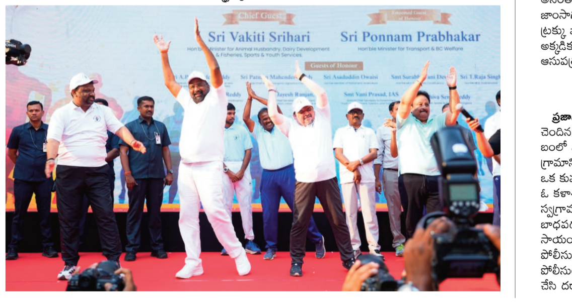
ప్రజానావ, హైదరాబాద్: ప్రజాపాలనలో భాగంగా రాష్ట్రవ్యాప్తంగా మే 18 నుండి 23 వరకు యువజన, క్రీడా వారోత్సవాలు ఘనంగా ప్రారంభమయ్యాయి.

హైదరాబాద్ లోని ఎల్పీజి డిలివరీలో మంత్రుల జంబా దాన్స్.. బందు కిలోమీటర్ల వాకథాన్ ప్రారంభం. ప్రజానావ, హైదరాబాద్: ప్రజాపాలనలో భాగంగా రాష్ట్రవ్యాప్తంగా మే 18 నుండి 23 వరకు యువజన, క్రీడా వారోత్సవాలు ఘనంగా ప్రారంభమయ్యాయి. హైదరాబాద్ లోని ఎల్పీజి డిలివరీలో మంత్రుల జంబా దాన్స్.. బందు కిలోమీటర్ల వాకథాన్ ప్రారంభం. ప్రజానావ, హైదరాబాద్: ప్రజాపాలనలో భాగంగా రాష్ట్రవ్యాప్తంగా మే 18 నుండి 23 వరకు యువజన, క్రీడా వారోత్సవాలు ఘనంగా ప్రారంభమయ్యాయి. హైదరాబాద్ లోని ఎల్పీజి డిలివరీలో మంత్రుల జంబా దాన్స్.. బందు కిలోమీటర్ల వాకథాన్ ప్రారంభం.