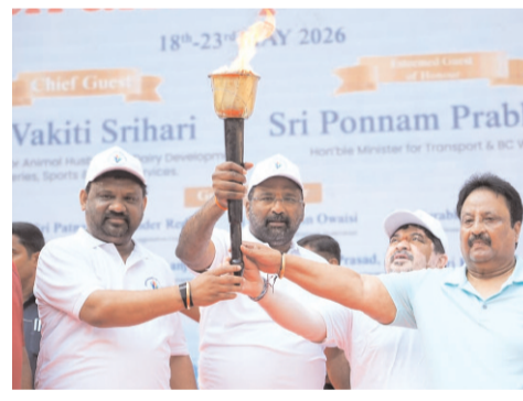
ప్రజానావ, హైదరాబాద్: ప్రజాపాలనలో భాగంగా రాష్ట్రవ్యాప్తంగా మే 18 నుండి 23 వరకు యువజన, క్రీడా వారోత్సవాలు ఘనంగా ప్రారంభమయ్యాయి.

ఎల్పీజి డిలివరీలో మంత్రుల జంబా దాన్స్.. బందు కిలోమీటర్ల వాకథాన్ ప్రారంభం