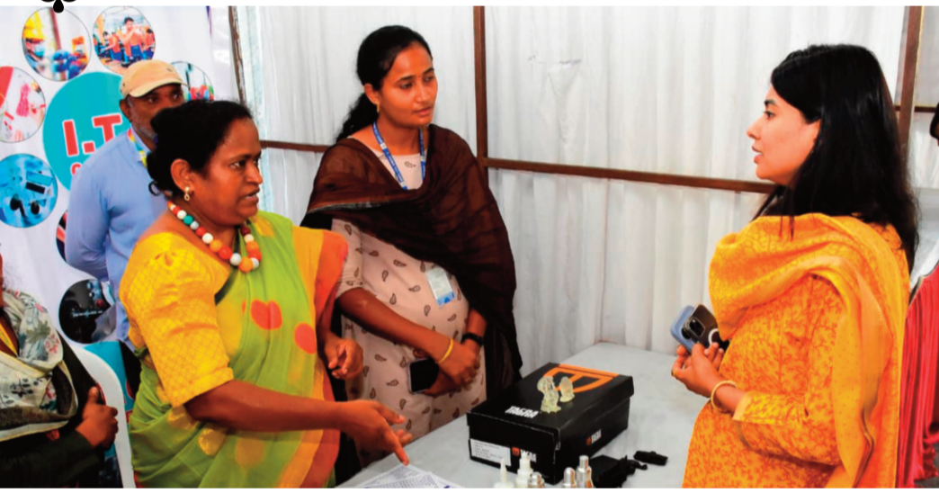
కింద 'సమ్మర్ క్యాంపులు' నిర్వహించామని, విద్యార్థులు సబ్సిడీయోగం చేసుకొని ఎన్నో అంశాల్లో ప్రతిభ చూపారని గుర్తు చేశారు. విద్యతోపాటు ఆటలు ఆడాలని, దీంతో శారీరక, మానసిక సమతుల్యత ఉంటుందని, క్రమ శిక్షణ అలవడుతుందని వివరించారు. ఉన్నత చదువుతోపాటు టెక్నికల్ స్కిల్స్, సాఫ్ట్ స్కిల్స్ నేర్చుకోవాలని సూచించారు. ఇప్పటి వరకు ప్రజలకు ఎలాంటి స్కిల్స్ అవసరమో తెలుసుకొని ఆ దిశలో ముందుకు వెళ్లాలని పిలుపు నిచ్చారు. ఐడీఓ, అడ్వాన్స్ టెక్నాలజీ సెంటర్, ఆర్ సీటీ, జీఎంఆర్, ఐడీటీఆర్, టాస్కో తదితర సంస్థల్లో అందిస్తున్న ఉచిత శిక్షణ కోర్సులను సబ్సిడీయోగం చేసుకోవాలని పిలుపు నిచ్చారు. పూర్తి వివరాలకు ఆయా సంస్థల్లో సంప్రదించాలని సూచించారు. అడ్వాన్స్ టెక్నాలజీ సెంటర్ లో శిక్షణ పొందిన వారికి పలు సంస్థలు ఉపాధి కల్పిస్తాయని తెలిపారు. పరిశ్రమల శాఖ, ఇతర ప్రభుత్వ శాఖల ఆధ్వర్యంలో అందిస్తున్న స్వయం ఉపాధి స్కీములు,