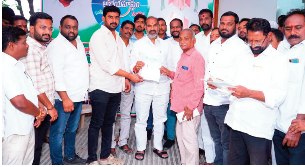
పథకాల చేరేలా చర్యలు తీసుకుంటున్నారని తెలిపారు. ఆర్థిక సహాయం తమకు ఎంతో ఉపశమనంగా లబ్ధిదారులు ప్రభుత్వానికి కృతజ్ఞతలు తెలుపుతూ, ఈ మారినదన్నారు.

ప్రజానావ, వేములవాడ: రాజన్న సిరిసిల్ల జిల్లా వేములవాడ నియోజకవర్గ పరిధిలో ముఖ్యమంత్రి సహాయనిధి కింద మంజూరైన చెక్కులను రాష్ట్ర ప్రభుత్వ విప్ ఆది శ్రీనివాస్ లబ్ధిదారులకు పంపిణీ చేశారు. వేములవాడ పట్టణ పరిధిలోని 30 మంది అర్బులైన లబ్ధిదారులకు రూ.9 లక్షల 83 వేల విలువైన చెక్కులను అందజేశారు. అలాగే వేములవాడ రూరల్ మండల పరిధిలో 13 మంది లబ్ధిదారులకు రూ.4 లక్షల 32 వేల చెక్కులను పంపిణీ చేశారు. ఈ సందర్భంగా ప్రభుత్వ విప్ ఆది శ్రీనివాస్ మాట్లాడుతూ.. పేద, మధ్యతరగతి కుటుంబాలకు అత్యవసర వైద్య, ఆర్థిక అవసరాల సమయంలో ముఖ్యమంత్రి సహాయనిధి ఎంతో ఉపయోగపడుతోందన్నారు. ప్రజల సంక్షేమమే ప్రభుత్వ ప్రధాన లక్ష్యమని, అర్బులైన ప్రతి ఒక్కరికీ ప్రభుత్వ