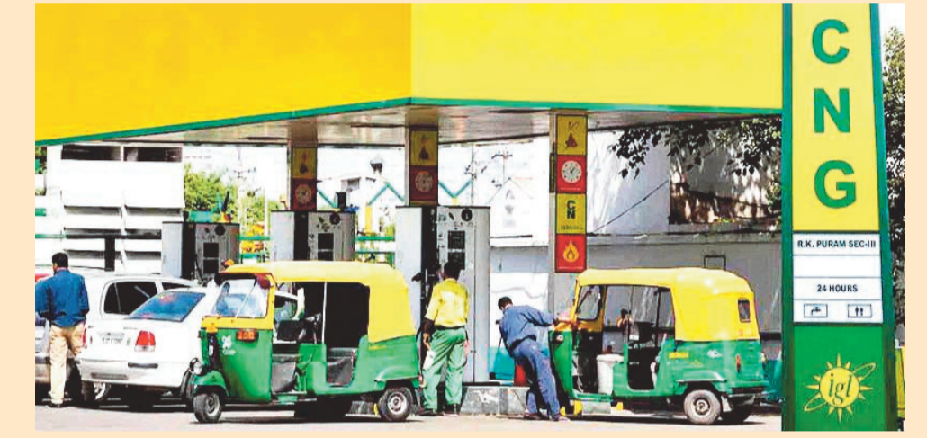
ఎన్నికలు ముగిసాక వరుసగా ధరలు పెంచుకుంటూ పోతున్నది. తాజాగా మరోసారి ఇంధన ధరలను పెంచింది. సోమవారం నాడు పెట్రోల్ పై లీటర్ కు రూ. 2.61, డీజిల్ పై లీటర్ కు రూ. 2.71 చొప్పున ధరలు పెరిగాయి. తాజా పెంపుతో మే 15 నుంచి

న్యూఢిల్లీ: కేంద్రం మళ్లీ పాకిచ్చింది. సిఎన్జి ధరలను మరోసారి పెంచింది. కిలో సీఎన్జిపై రూ.2 పెంచింది. పెరిగిన ధరలు మంగళవారం నుంచే అమలులోకి వచ్చాయి. తాజా పెంపుతో ఢిల్లీలో సీఎన్జి ధర రూ.81.09 నుంచి రూ.83.09కి చేరింది. సీఎన్జి ధరలను పెంచడం మే 15వ తేదీ నుంచి ఇది నాలుగోసారి కావడం గమనార్హం. మే 15వ తేదీన మొదట కిలోకు రూ.2 పెంచగా.. అనంతరం రెండుసార్లు ఒక్క రూపాయి చొప్పున కేంద్రం పెంచింది. తాజాగా మరో రూ.2 పెరగడంతో నాలుగోసారి సీఎన్జి ధరలు పెరిగినట్లయ్యింది. గత 11 రోజుల్లో మొత్తం రూ.7 వరకు ధరలు పెరగడంతో వాహనదారులు, ఆటో, క్యాబ్, ట్రాన్స్పోర్ట్ రంగాలపై అదనపు భారం పడనుంది. ఎన్నికల ముందు ఇంధన ధరలు పెంచబోమని పదేపదే ప్రకటించిన కేంద్రం..