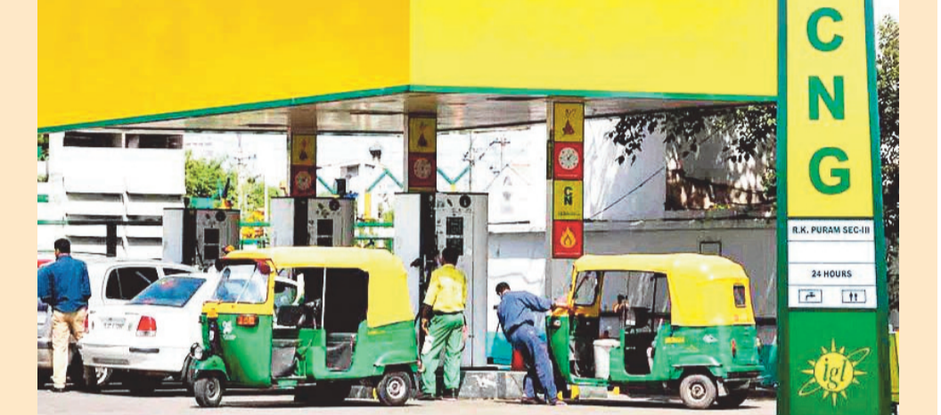
ఎన్నికలు ముగిసాక వరుసగా ధరలు పెంచుకుంటూ పోతున్నది. తాజాగా మరోసారి ఇంధన ధరలను పెంచింది. సోమవారం నాడు పెట్రోల్పై లీటర్కు రూ. 2.61, డీజిల్పై లీటర్కు రూ. 2.71 చొప్పున ధరలు పెరిగాయి. తాజా పెంపుతో మే 15 నుంచి లీటర్కు మొత్తం పెంపు రూ. 7.5కు చేరింది. గడవిన 11 రోజుల్లో ఇంధన ధరలు పెరుగడం ఇది నాలుగోసారి. ఢిల్లీలో లీటర్ పెట్రోల్ ధర రూ. 99.51 నుంచి రూ. 102.12 చేరుకోగా లీటర్ డీజిల్ ధర రూ. 92.49 నుంచి రూ. 95.20కి పెరిగింది.

న్యూఢిల్లీ: కేంద్రం మళ్లీ పాకిచ్చింది. సిఎన్జి ధరలను మరోసారి పెంచింది. కిలో సీఎన్జిపై రూ.2 పెంచింది. పెరిగిన ధరలు మంగళవారం నుంచే అమలులోకి వచ్చాయి. తాజా పెంపుతో ఢిల్లీలో సీఎన్జి ధర రూ.81.09 నుంచి రూ.83.09కి చేరింది. సీఎన్జి ధరలను పెంచడం మే 15వ తేదీ నుంచి ఇది నాలుగోసారి కావడం గమనార్హం. మే 15వ తేదీన మొదట కిలోకు రూ.2 పెంచగా.. అనంతరం రెండుసార్లు ఒక్క రూపాయి చొప్పున కేంద్రం పెంచింది. తాజాగా మరో రూ.2 పెరగడంతో నాలుగోసారి సీఎన్జి ధరలు పెరిగినట్లయ్యింది. గత 11 రోజుల్లో మొత్తం రూ.7 వరకు ధరలు పెరగడంతో వాహనదారులు, ఆటో, క్యాబ్, ట్రాన్స్పోర్ట్ రంగాలపై అదనపు భారం పడనుంది. ఎన్నికల ముందు ఇంధన ధరలు పెంచబోమని పదేపదే ప్రకటించిన కేంద్రం..