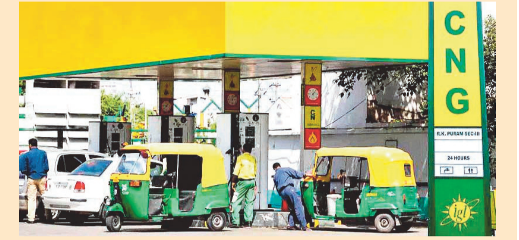
ఎన్నికలు ముగిసాక వరుసగా ధరలు పెంచుకుంటూ పోతున్నది. తాజాగా మరోసారి ఇంధన ధరలను పెంచింది. సోమవారం నాడు పెట్రోల్ పై లీటర్ కు రూ. 2.61, డీజిల్ పై లీటర్ కు రూ. 2.71 చొప్పున ధరలు పెరిగాయి. తాజా పెంపుతో మే 15 నుంచి

న్యూఢిల్లీ: కేంద్రం మళ్లీ పాకిచ్చింది. సిఎన్జి ధరలను మరోసారి పెంచింది. కిలో సీఎన్జిపై రూ.2 పెంచింది. పెరిగిన ధరలు మంగళవారం నుంచే అమలులోకి వచ్చాయి. తాజా పెంపుతో ఢిల్లీలో సీఎన్జి ధర రూ.81.09 నుంచి రూ.83.09కి చేరింది. సీఎన్జి ధరలను పెంచడం మే 15వ తేదీ నుంచి ఇది నాలుగోసారి కావడం గమనార్హం. మే 15వ తేదీన మొదట కిలోకు రూ.2 పెంచగా.. అనంతరం రెండుసార్లు ఒక్క రూపాయి చొప్పున కేంద్రం పెంచింది. తాజాగా మరో రూ.2 పెరగడంతో నాలుగోసారి సీఎన్జి ధరలు పెరిగినట్లయ్యింది. గత 11 రోజుల్లో మొత్తం రూ.7 వరకు ధరలు పెరగడంతో వాహనదారులు, ఆటో, క్యాబ్, ట్రాన్స్పోర్ట్ రంగాలపై అదనపు భారం పడనుంది. ఎన్నికల ముందు ఇంధన ధరలు పెంచబోమని పదేపదే ప్రకటించిన కేంద్రం..