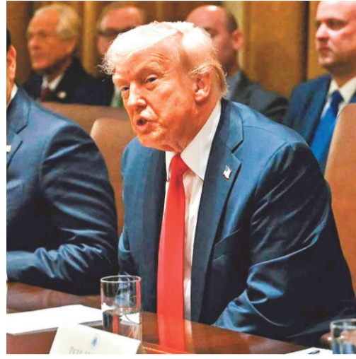
కఠిన నిర్ణయాలు తీసుకుంటామని కూడా చెప్పారు. కాగా, తమ వద్ద ఉన్న శుద్ధ చేసిన యురేనియంను పదులుకోవడానికి ఇరాన్ అంగీకరించినట్లు వార్తలు

వాషింగ్టన్: అమెరికా-ఇరాన్ మధ్య జరుగుతున్న శాంతి చర్చల్లో అణు కార్యక్రమం కీలకంగా మారింది. శుద్ధ చేసిన యురేనియంను పదులుకోవాలని అమెరికా కోరుతుండగా, అందుకు ఇరాన్ పూర్తిగా అంగీకరించడం లేదు. తాజాగా ఇరాన్ అణు కార్యక్రమంపై అమెరికా అధ్యక్షుడు డొనాల్డ్ ట్రంప్ కీలక వ్యాఖ్యలు చేశారు. ఇరాన్ వద్ద ఉన్న అధికంగా శుద్ధ చేసిన యురేనియంను అమెరికాకు అప్పగించాలని, లేదంటే అంతర్జాతీయ పర్యవేక్షణలో పూర్తిగా ధ్వంసం చేయాలని ట్రంప్ స్పష్టం చేశారు. ఇరాన్ అణు కార్యక్రమం ప్రపంచ దేశాలకు ముప్పుగా మారే అవకాశముందని ట్రంప్ హెచ్చరించారు. అధిక శుద్ధ చేసిన యురేనియం ద్వారా అణ్వాయుధాల తయారీ సాధ్యమవుతుందని, అందుకే దీనిపై కఠిన చర్యలు అవసరమని పేర్కొన్నారు. అమెరికా జాతీయ భద్రతను కాపాడేందుకు అవసరమైతే మరింత