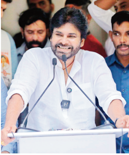
కొట్టివేసింది. దీంతో సభకు బ్రేక్ పడింది. మరోవైపు పవన్ ఇంటి వద్దకు అభిమానులు, కార్యకర్తలు భారీగా చేరుకోవడంతో పోలీసులు వారిని అడ్డుకున్నారు.

గళం వినిపించే తెగువ తెలంగాణ నేలకే ఉందని స్పష్టం చేశారు. ఐటీ, ఫార్మా, వ్యవసాయ రంగాల్లో రాష్ట్రం మరింత అభివృద్ధి చెందాలని, ఆ అభివృద్ధి ఫలాలు అట్టడుగు వర్గాలకు చేరాలని ఆయన ఆకాంక్షించారు.