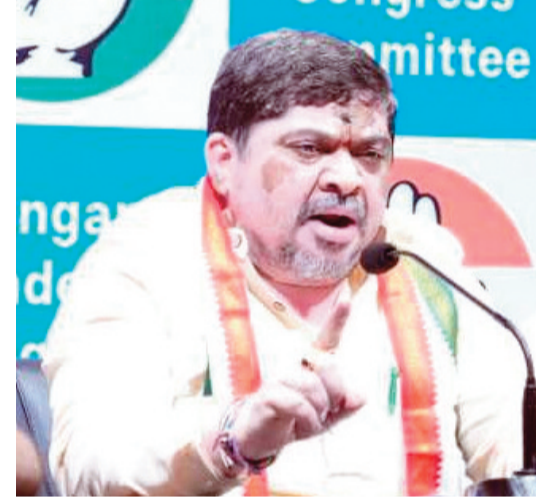
ప్రశ్నించారు. తమకు ఆంధ్రప్రదేశ్ లోనే దిక్కులేదని పవన్ చెప్పుకున్నాడని మంత్రి ఎద్దేవా చేశారు. ఉద్యమ సమయంలో కూడా ఆంధ్రా వాళ్లను తాము ఏమీ అనలేదని, కానీ తాము ఆంధ్రా వాళ్లను ఏమో అన్నట్లు పవన్ కల్యాణ్ అబద్ధాలు చెబుతున్నారని ఆగ్రహం వ్యక్తం చేశారు. పార్లమెంటులో ఏ బిల్లు చేసినా తలుపులు మూసి పాస్ చేస్తారని మంత్రి వివరించారు. కొండగట్టుకు ఇచ్చిన పైసలు పవన్ అయ్య జాగీరా అని సందేహం వ్యక్తం