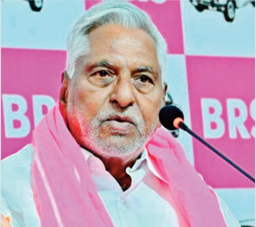
ఖరీఫ్ పంటకై నైతు భరోసా కల్పించాలని డిమాండ్