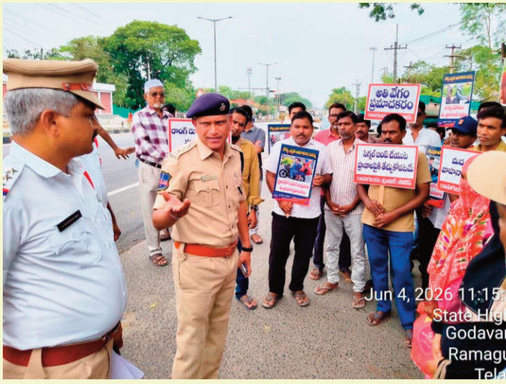
Jun 4, 2026 11:15 State High Godavari Ramagiri Telangana