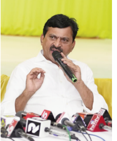
పరిస్థితులు ఎప్పటికీ వుండు మారకుంటాయని, భవిష్యత్తులో ఏం జరుగుతుందో ముందుగానే నిర్ణయించడం సాధ్యం కాదన్నారు. భూముల యాజమాన్య వివాదాలు, నకిలీ పాస్ బుక్కుల అంశాలపై విలేజ్ లు అడిగిన ప్రశ్నలకు సరిపదిస్తూ, ప్రస్తుతం న్యాయస్థానాల పరిధిలో ఉన్న వ్యవహారాలపై ప్రభుత్వం బహిరంగంగా వ్యాఖ్యలు నివ్వడం సముచితం కాదని తెలిపారు. కోర్టుల్లో ఉన్న కేసుల్లో ప్రభుత్వ తరపున న్యాయవాదులు, గవర్నమెంట్ డ్విడెంట్, అడ్వకేట్ జనరల్ తగిన

వాదనలు వినిపిస్తారని చెప్పారు. ప్రైవేట్ వ్యక్తుల మధ్య తలెత్తే భూ వివాదాలకు న్యాయస్థానాలే సరైన పరిష్కార వేదిక అని పేర్కొన్న మంత్రి, ప్రభుత్వ పరిపాలనా పరిధిలోకి వచ్చే సమస్యల విషయంలో మాత్రం ప్రజల ప్రయోజనాలను దృష్టిలో ఉంచుకుని బాధ్యతాయుత నిర్ణయాలు తీసుకుంటామని స్పష్టం చేశారు. సీఎం వ్యాఖ్యలపై అసహనం వివాదం ఈ సందర్భంగా ముఖ్యమంత్రి చేసిన వ్యాఖ్యలపై నెలకొన్న రాజకీయ వివాదాన్ని ప్రస్తావించిన మంత్రి, ఒక నిర్దిష్ట సందర్భంలో చేసిన వ్యాఖ్యలను ప్రతిపక్షాలు ఉద్దేశపూర్వకంగా వక్రీకరిస్తున్నాయని ఆరోపించారు. ముఖ్యమంత్రి చెప్పిన మాటల అసలు భావాన్ని వక్రీకరించే ప్రయత్నం చేస్తున్నారని విమర్శించారు. సోషల్ మీడియా వేదికలలో పాటు ఇతర మాధ్యమాల ద్వారా వ్యాఖ్యలకు విరుద్ధంగా ప్రచారం జరుగుతోందని పేర్కొన్న ఆయన, వ్యాఖ్యలు చేసిన సందర్భం, వాటి నేపథ్యాన్ని పూర్తిగా అర్థం చేసుకోకుండా అపోహలు సృష్టించడం బాధాకరమన్నారు. ప్రజల సమస్యలపై పరిష్కారం చేసే ప్రభుత్వ ప్రధాన లక్ష్యమని, రాజకీయ విమర్శలకు బదులుగా అభివృద్ధి, సంక్షేమ కార్యక్రమాల అమలుపైనే ప్రభుత్వం దృష్టి సారించిందని మంత్రి పొంగులేటి శ్రీనివాసరెడ్డి తెలిపారు.