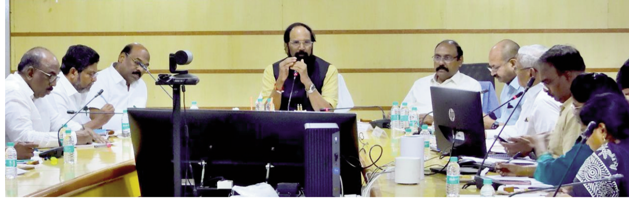
సౌర విద్యుత్ ఉత్పత్తి అవకాశాలను గుర్తించి ప్రతిపాదనలు సిద్ధం చేయాలని అధికారులను ఆదేశించారు.