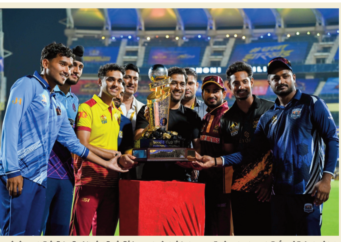
రాంబీలోని జార్జ్ స్టేట్ క్రికెట్ అసోసియేషన్ (జేపీసీఏ) అంతర్జాతీయ స్టేడియం కాంప్లెక్స్లో బుద్ధవారం జార్జ్ స్టేట్ టీ20 లీగ్ ప్రారంభోత్సవ కార్యక్రమాన్ని నిర్వహించారు. ఈ వేడుకకు టీమిండియా మాజీ క్రికెటర్ మహేంద్ర సింగ్ ధోనీ హాజరయ్యారు.