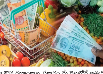
ఆహార పదార్థాల ప్రకారం మే నెలలోనే అత్యధిక ద్రవ్యోల్బణం నమోదైంది. ఆహార ద్రవ్యోల్బణం ఏప్రిల్ లో 4.20 శాతంగా ఉండగా, మేలో 4.78 శాతానికి పెరిగింది. ప్రపంచం ఇంధన రవాణాకు కీలకమైన హార్బర్లలో జలసంధిలో కొ

న్యూఢిల్లీ: పశ్చిమాసియా ఉద్రిక్తత ప్రభావం భారత్ లో పాటు ప్రపంచం దేశాల ఆర్థిక వ్యవస్థలపై స్పష్టంగా కనిపిస్తోంది. ఆహార పదార్థాలు, ఇంధన ధరల పెరుగుదలతో దేశంలో రిటైల్ ద్రవ్యోల్బణం మే నెలలో 3.93 శాతానికి చేరింది. కేంద్ర ప్రభుత్వం విడుదల చేసిన తాజా గణాంకాల ప్రకారం, ఏప్రిల్ లో 3.48 శాతంగా ఉన్న ద్రవ్యోల్బణం నెలరోజుల్లోనే గణనీయంగా పెరిగింది. అయితే, ఇది ఇంకా ఆర్బీఐ నిర్దేశించిన మధ్యకాల లక్ష్య పరిధిలోనే ఉంది. వినియోగదారుల జీవనశైలిలో వచ్చిన మార్పులను దృష్టిలో ఉంచుకుని ధరల నూటి లెక్కలలో కేంద్రం ఈ ఏడాది ప్రారంభంలో సవరణలు చేపట్టింది.