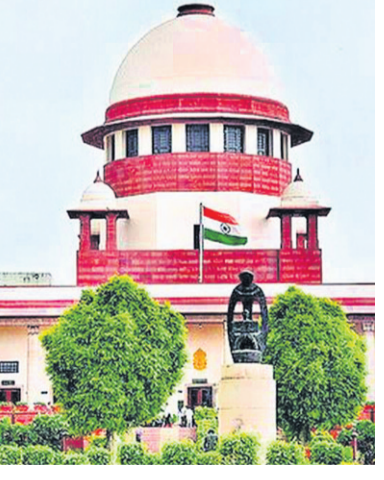
నటరాజన్ సుప్రీంకోర్టును ఆశ్రయించగా, తాజాగా అక్కడ కూడా ఆమెకు నిరాశ ఎదురైంది.

పిటిషన్ కమిషన్ ను ఆశ్రయించడమే సరైన మార్గమని సూచన