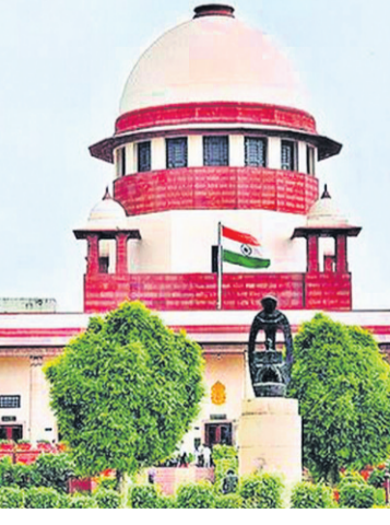
నటరాజన్ సుప్రీంకోర్టును ఆశ్రయించగా, తాజాగా అక్కడ కూడా ఆమెకు నిరాశ ఎదురైంది.

పిటిషన్ కమిషన్ ను ఆశ్రయించడమే సరైన మార్గమని సూచన