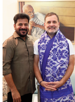
అలిగంపే చేసుకున్నారని చెప్పారు. తెలంగాణ పట్ల కేంద్ర ప్రభుత్వం వివక్ష చూపుతోందని రేవంత్ రెడ్డి ఆరోపించారు. కేంద్ర మంత్రి కిషన్ రెడ్డి బీజేపీ అధికారం వచ్చినప్పుడు తప్పేదేమీ లేదని ఆరోపించారు. రేవంత్ రెడ్డి ఆరోపణలకు మేరకు వ్యవహరిస్తున్నారని విమర్శించారు. రాష్ట్రానికి రావాల్సిన పలు ప్రాజెక్టుల నిధుల విడుదల, రీ

జిసల్ రింగ్ రోడ్ వంటి అంశాల్లో కిషన్ రెడ్డి అడ్డంకిగా మారారని ఆరోపించారు. తెలంగాణ ప్రయోజనాల కోసం ప్రధాని వద్ద ఒక్కసారి ఆయన గట్టిగా మాట్లాడారా అని ఆయనను ప్రశ్నించారు. బీజేపీ కార్యకర్తలా.. బీజేపీకి ఓట్ల చోరీ, సీట్ల చోరీ మాత్రమే తెలుసని సీఎం విమర్శించారు. తెలంగాణ కాంగ్రెస్ వ్యవహారాల ఇన్ చార్జ్ మీనాక్షి నటరాజన్ రాజ్యసభ నామినేషన్ తిరస్కరణ అత్యంత బాధాకరమని, ఆమెపై ఎలాంటి ఎఫ్ బి ఆర్ లేకపోయినా నామినేషన్ తిరస్కరణ అత్యంత అప్రజాస్వామిక చర్య అని ఆన్నారు. ఈ వ్యవహారంలో రిటర్నింగ్ అధికారి బీజేపీ కార్యకర్తలా వ్యవహరించారని ఆరోపించారు. బీజేపీ మహిళా వ్యతిరేక పార్టీ అని వ్యాఖ్యానించారు. అనంతరం కాంగ్రెస్ అగ్రనేత రాహుల్ గాంధీ ఆయనకు