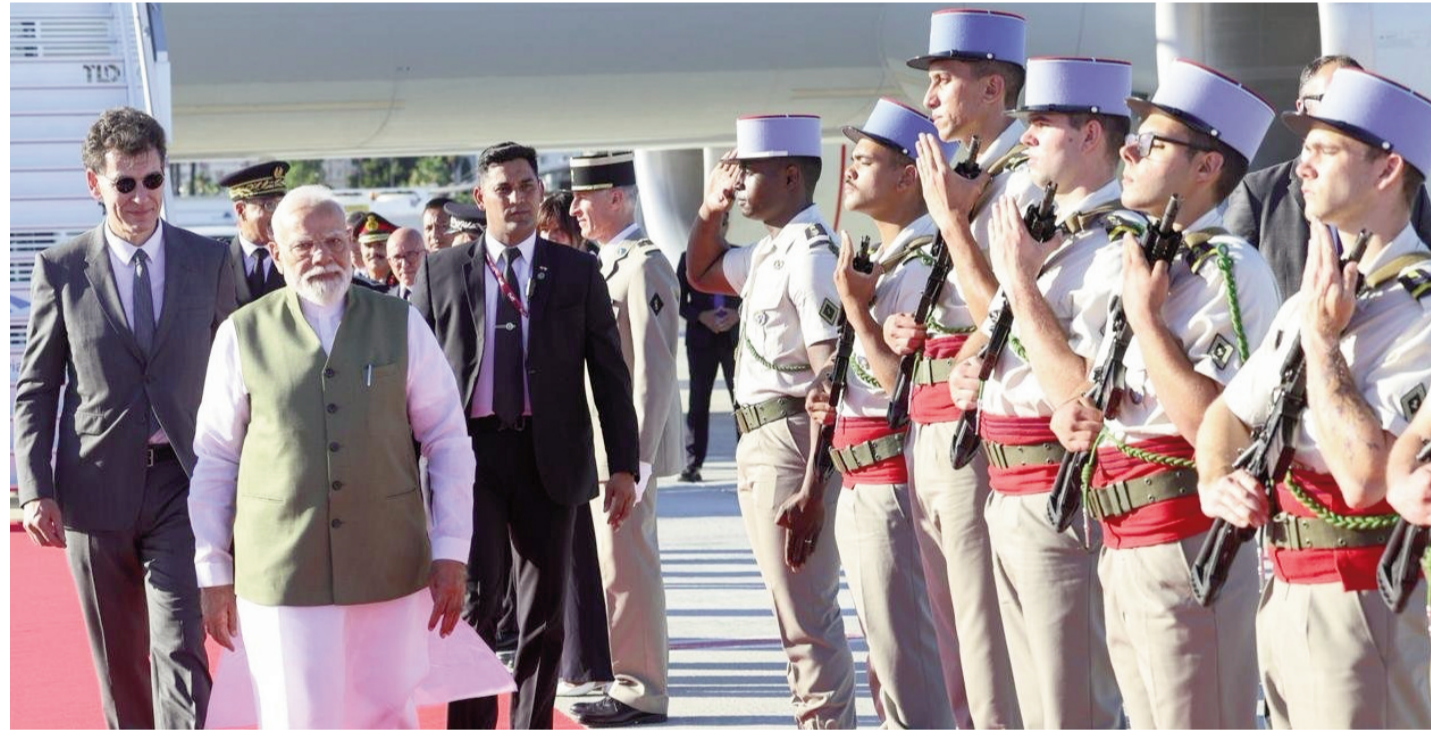
రెండ్రోజుల పర్యటనలో భాగంగా ప్రధాని నరేంద్ర మోదీ శనివారం ఫ్రాన్స్, స్లోవేకియా పర్యటనకు బయల్దేరి వెళ్లారు. ఇరుదేశాలతో ద్వైపక్షిక, వాణిజ్య, వ్యాపార సంబంధాలపై చర్చలు జరపనున్నారు. ఈ సందర్భంగా ఫ్రాన్స్ లో జరిగే జీ7 దేశాల సదస్సుకు హాజరై వివిధ దేశాధిపత్యాలతో సమావేశమవుతారు. ఇదిలాఉంటే 1993 తర్వాత భారత ప్రధాని స్లోవేకియాలో పర్యటించనుండడం ఇదే మొదటిసారి.