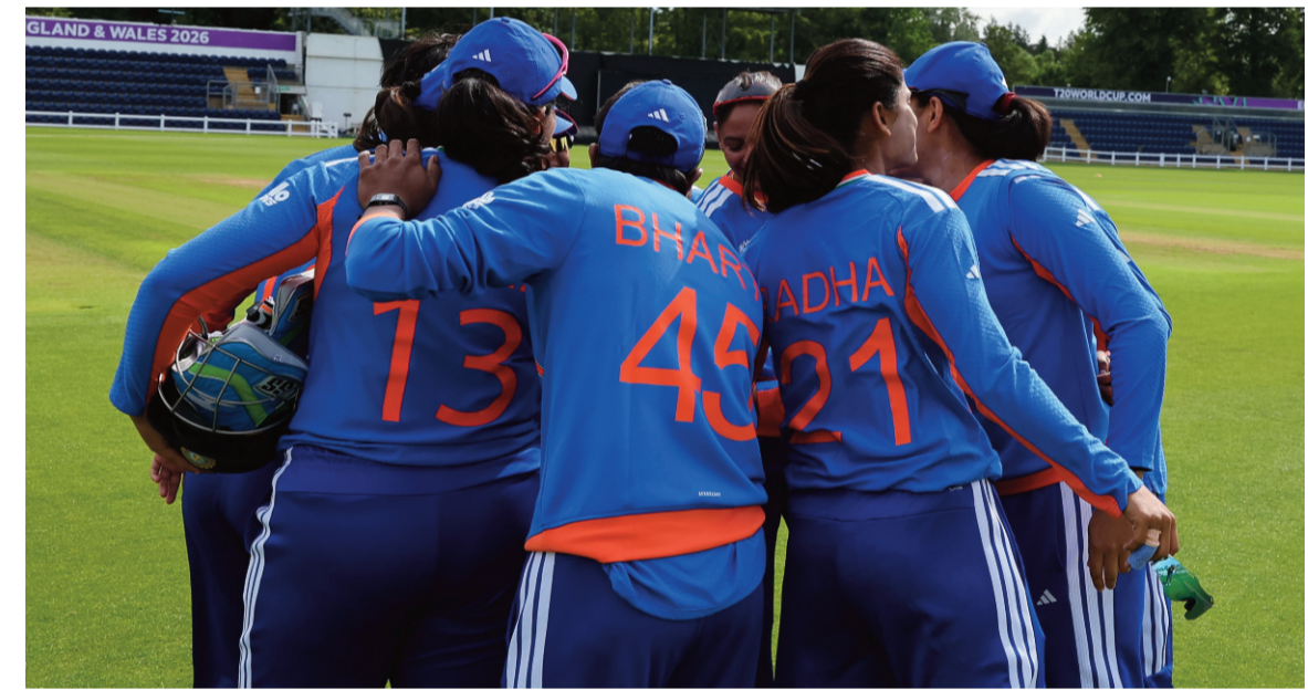
ఎదుర్కొంటున్న భారత్ ఆసక్తికరంగా మారింది.