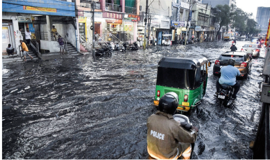
వాటర్ బోర్డు సహా అన్ని శాఖలు పరస్పర సమన్వయం లు తరిస్తూ ఉండేలా యుద్ధ ప్రాతిపదికన చర్యలు చేపట్టాలని ముఖ్యమంత్రి స్పష్టం చేశారు.

హైదరాబాద్లోని పలు ప్రాంతాల్లో ఆదివారం భారీ వర్షం కురిసింది. జూబిలీహిల్స్, బంజారాహిల్స్, అమీర్ పేట్, యూసఫ్ గూడ, ననకొనగల్, ఫిల్మ్ నగర్, పంజాగుట్ట, ఎర్రగడ్డ, జోరబండ, మహేశ్వరం, తుమ్మగూడ, పహాడిష రిస్ట్, కుత్బుల్లాపూర్, బాచుపల్లి, హైదరాబాద్, ప్రగతి నగర్, మూసాపేట్ తదితర ప్రాంతాల్లో వర్షం కురవడంతో రోడ్లపై నీరు నిలిచింది. శంషాబాద్లో కురిసిన భారీ వర్షానికి ప్రధాన రహదారి జలమయమై చెరువును తలపించింది. రోడ్లంతా నీటితో నిండిపోవడంతో వాహనదారులు, ప్రయాణికులు తీవ్ర ఇబ్బందులు ఎదుర్కొన్నారు. రాష్ట్రంలో భారీ వర్షాలు కురుస్తున్న నేపథ్యంలో ముఖ్యమంత్రి రేవంత్ రెడ్డి ఉన్నతాధికారులను అప్రమత్తం చేశారు. హైదరాబాద్ కోర్ ఆర్గన్ రిజియన్ పరిధిలో హైఅలర్ట్ ప్రకటించి పరిస్థితిని ఎప్పటికప్పుడు సమీక్షించాలని ఆదేశించారు. సగరవాసులకు ఇబ్బందులు తరిస్తూ ఉండేలా యుద్ధ ప్రాతిపదికన చర్యలు చేపట్టాలని సూచించారు. వాతావరణ శాఖ హెచ్చరికల ఆధారంగా ముందస్తు ప్రణాళికలతో సిద్ధంగా ఉండాలని, లోతట్టు ప్రాంతాలు, సమస్యకర ప్రాంతాలను గుర్తించి అత్యవసర బృందాలను మోపించాలని అధికారులను ఆదేశించారు. పోలీస్, ట్రాఫిక్ పోలీస్, మున్సిపల్, హైద్రా, విద్యుత్ శాఖ,