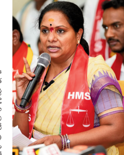
ఏర్పాటు కోసం హైదరాబాద్ లోని సింగరేణి భవనం ముట్టడించిన చరిత్ర తమదేనని పేర్కొన్నా నూ, ప్రస్తుతం సాధారణంగా పరిష్కారం కావాల్సిన సమస్యల కోసం కూడా కార్మికులు రోడ్లక్రీ ఆందోళన చేయాల్సి తరువాయి 2లో