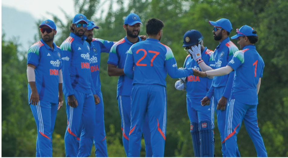
• ఉత్తంభరతి మ్యాచ్లో శ్రీలంక ఏ జట్టు ఘన విజయం

దంబుల్లా: ముక్కోణపు సిరీస్లో భాగంగా సోమవారం జరిగిన ఉత్తంభరతి మ్యాచ్లో శ్రీలంక ఏ జట్టు సూపర్ ఓవర్లో భారత్ ఏపై విజయం సాధించింది. నిర్ణయ 50 ఓవర్లలో