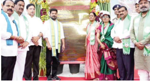
ప్రజానావ, రంగారెడ్డి: ప్రభుత్వ భూములను ఆక్రమించేందుకు ప్రయత్నించే వారిపై కఠిన చర్యలు తీసుకుంటామని ముఖ్యమంత్రి రేవంత్ రెడ్డి హెచ్చరించారు. భూకబ్బాల వల్ల ప్రజలు ఇబ్బందులు పడకూడా ఉండేందుకే హైద్రా వ్యవస్థను తరువాయి 2లో