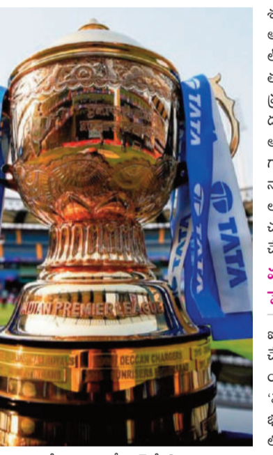
ఐపీఎల్ లో పాల్గొంటారు. వారి లభ్యత, అంతర్జాతీయ పెద్దమార్ట్, డ్రైవ్ మార్కెట్ సిరీస్ లు వంటి అనేక అంశాలను పరిగణనలోకి తీసుకోవాల్సి ఉంటుంది. ప్రస్తుతం 74 మ్యాచ్ లు నుంచి 94 మ్యాచ్ లకు పెంచే అంశంపై ఎలాంటి చర్చ జరగలేదు' అని తెలిపారు. భవిష్యత్తులో పరిస్థితులను బట్టి మార్పులు రావచ్చని పేర్కొన్నప్పటికీ, ప్రస్తుతానికి మ్యాచుల సంఖ్య పెంపుపై జరిగే అవకాశాలు చాలా తక్కువగా ఉన్నాయని బీసీసీఐ కార్యదర్శి స్పష్టం చేశారు.