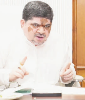
ప్రజానావ, హైదరాబాద్: తెలంగాణ రాష్ట్ర రోడ్డు రవాణా సంస్థ (టీటీఎస్ఆర్టీసీ) ఉద్యోగులకు