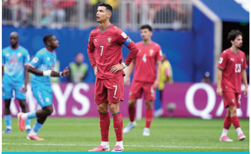
హెన్రీ ఫూటు విమర్శలు..